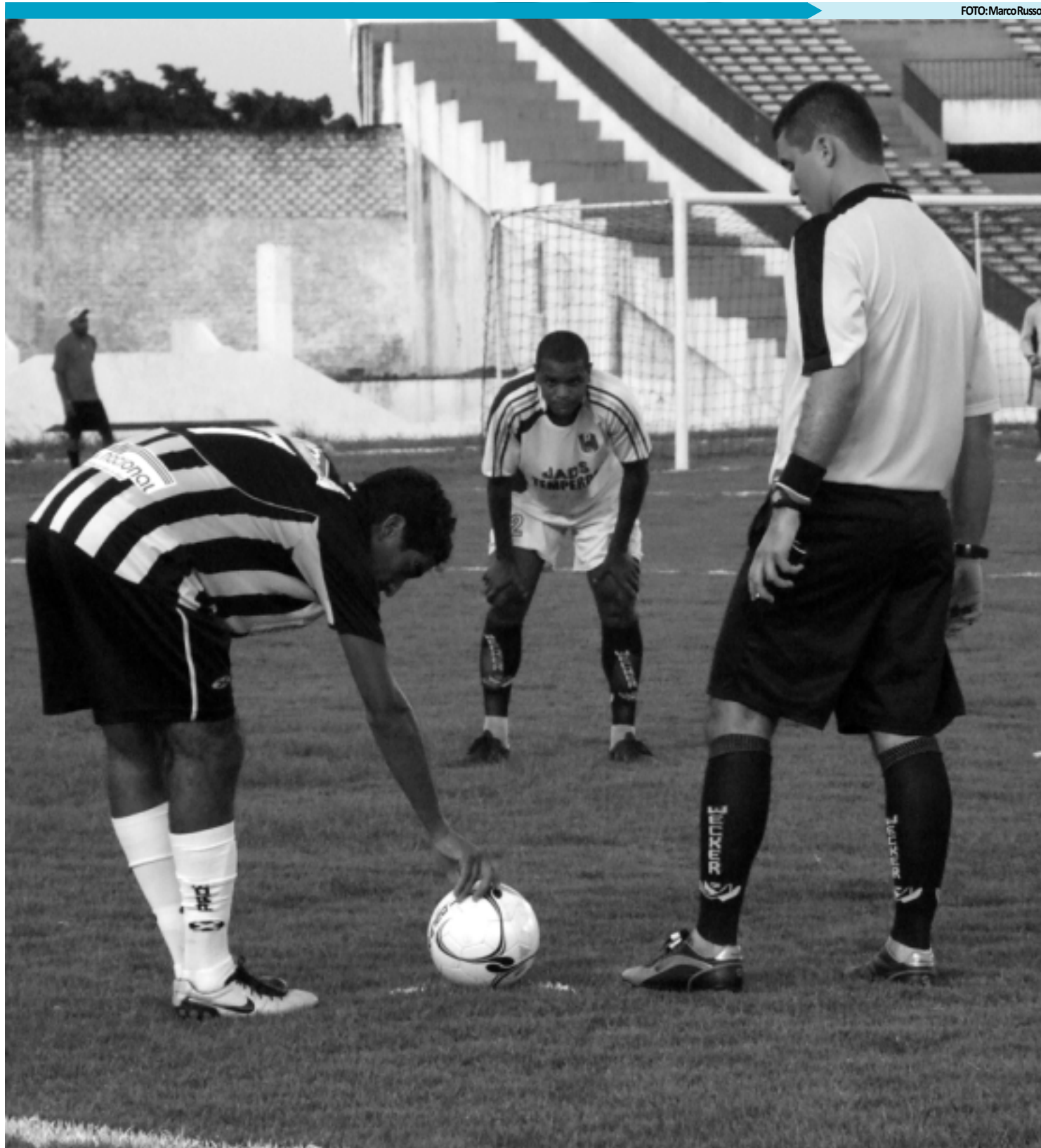
Botafogo e CSP vão relembrar, no próximo sábado, a decisão da Copa Paraíba do ano passado, quando o Alvinegro levou a melhor ao ser campeão

Sobre a contratação de reforços, o dirigente explicou que ainda trabalhando para anunciar o mais breve possível os nomes. "A torcida fique tranqüila que estamos trabalhando para trazer jogadores de qualidade", concluiu.