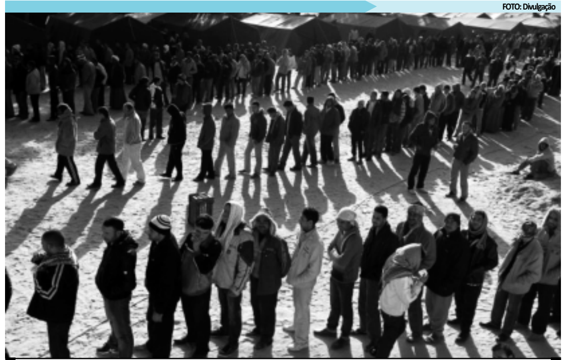
De acordo com a ACNUR, apenas nos últimos cinco dias, 75 mil pessoas teriam saído da Líbia e entrado na Tunísia

Trabalhadores imigrantes em fuga também são alvejados pelos insurgentes libios, que muitas vezes os confundem com os mercenários africanos que o governante líbio, Muamar Kadafi, trouxe para esmagar a insurgência. As informações são da Associated Press.