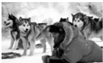
Resgate Abaixo de Zero, hoje na Globo