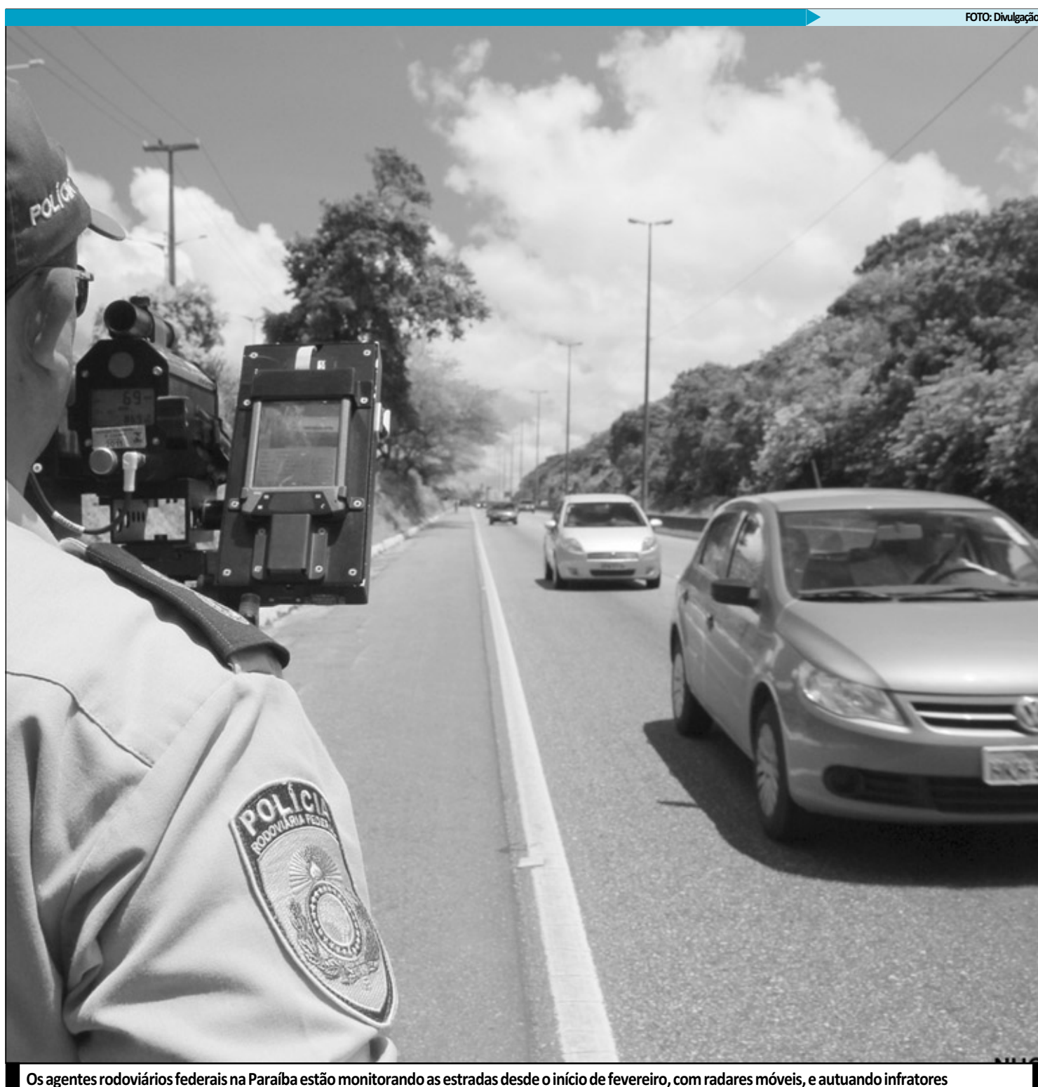
Os agentes rodoviários federais na Paraíba estão monitorando as estradas desde o início de fevereiro, com radares móveis, e autuando infratores

A Polícia Rodoviária Federal vai continuar utilizando o radar móvel, mesmo após o período da Operação Carnaval que começa na próxima sexta-feira (4) e encerra na Quarta-Feira de Cinzas (9), quando a fiscalização será mais rigorosa nas estradas. O objetivo é de buscar através da fiscalização, a conscientização dos usuários de rodovias quanto ao risco de acidentes principalmente na BR-230 entre Cabedelo e Santa Rita, onde se registra o maior número de ocorrências no Estado.