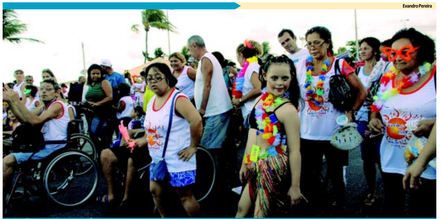
PRÉ-CARNAVAL Portadores da Folia desfilaram ontem; hoje tem Muriçocas PÁGINA 8 e 9

meta é construir cerca de dois milhões de moradias na Paraíba. As informações foram repassadas durante sessão especial realizada pela Assembleia para discutir mudanças no programa. PÁGINA 12