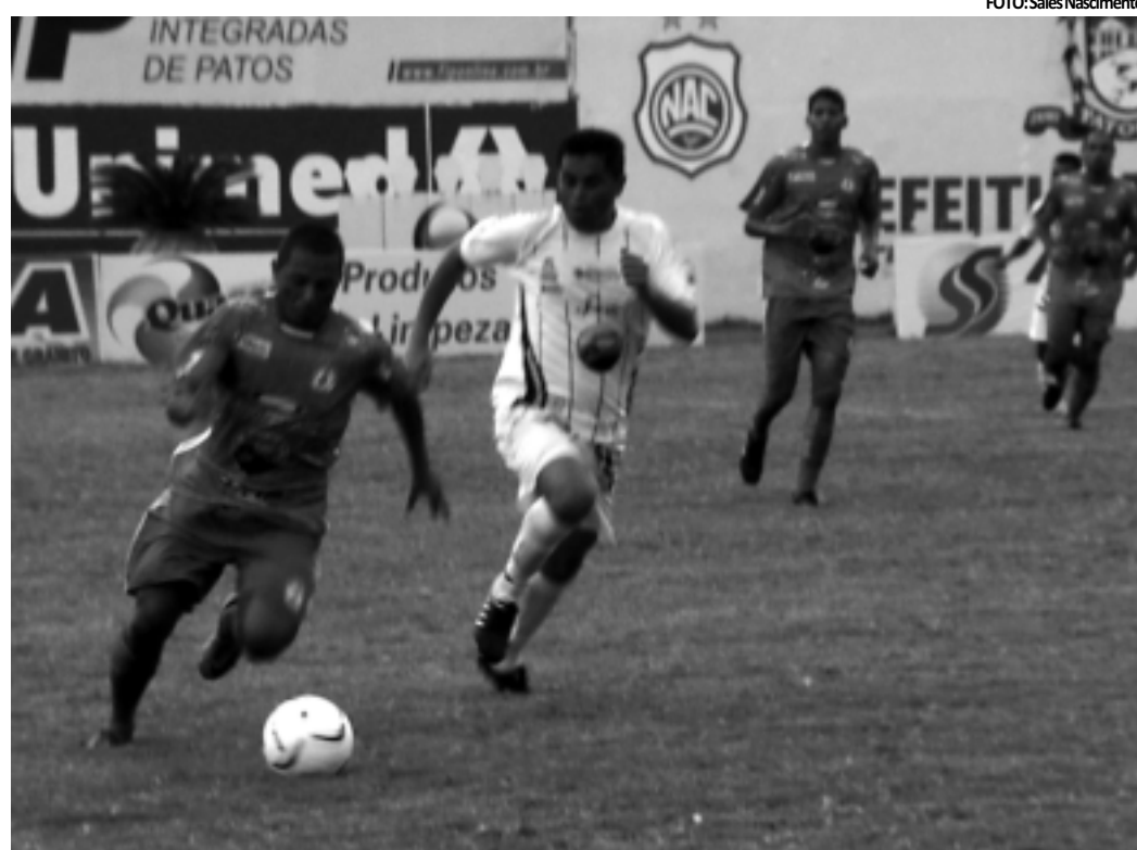
Depois de empatar em 1 a 1 com o Nacional, o Esporte volta a jogar em casa amanhã diante do Miramar