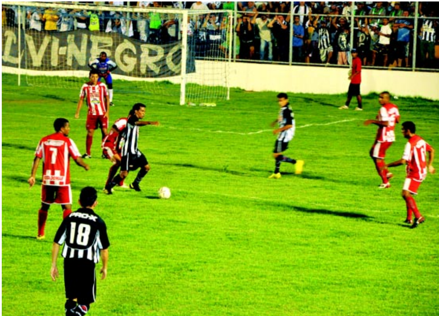
Botafogo e Auto Esporte fizeram um jogo de muito equilíbrio no estádio da Graça, num resultado ruim no Campeonato para as duas equipes