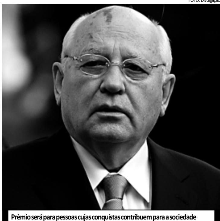
Prêmio será para pessoas cujas conquistas contribuem para a sociedade

Contribuição ao desenvolvimento da cultura em um mundo aberto (Glasnost: