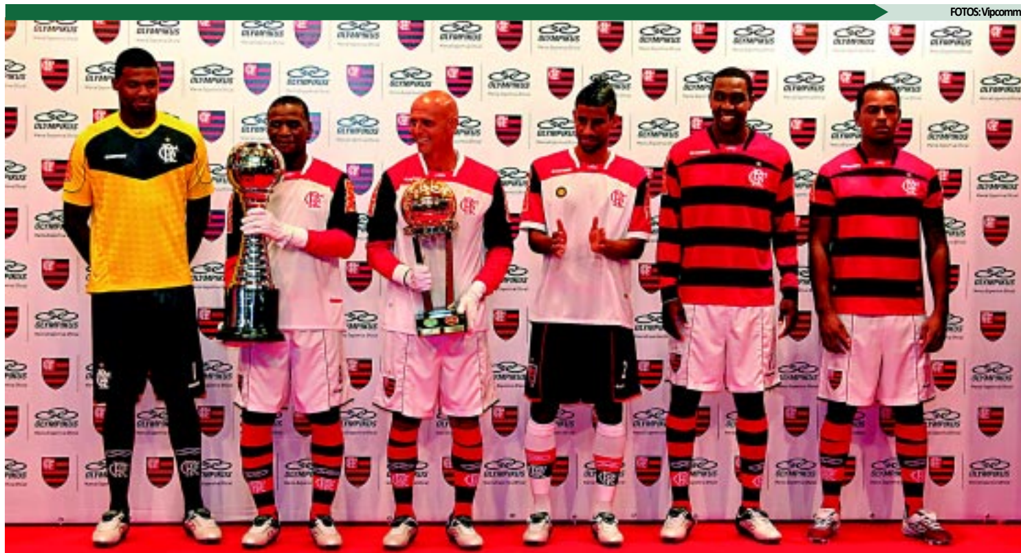
Flamengo apresentou o uniforme ainda sem o patrocinador master e com base nas conquistas da Libertadores e Mundial em 1981

A Olympikus, fornecedora de material esportivo, também apresentou os novos uniformes de treino e a linha