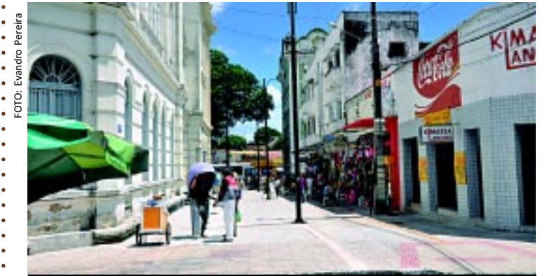
[FOTO&LEGENDA] A Secretaria de Infraestrutura de JP está implantando nova iluminação na Rua Desembargador Feitosa Ventura, ao lado do Paço Municipal. Três dos seis postes estão instalados e as obras fazem parte do Projeto de Revitalização do Centro Histórico.