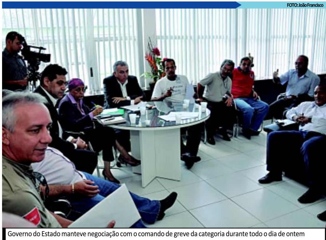
Governo do Estado manteve negociação com o comando de greve da categoria durante todo o dia de ontem

Pelo Twitter - Ontem, à noite, o governador Ricardo Coutinho garantiu 1.000 policiais militares e civis, além de bombeiros, e câmeras de filmagem em todo o percurso do bloco Muriçocas de Miramar, hoje.