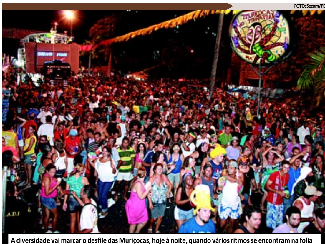
A diversidade vai marcar o desfile das Muriçocas, hoje à noite, quando vários ritmos se encontram na folia

vidade, união e alegria, toda a comissão organizadora do bloco e moradores do Miramar vibram em um só pensamento, numa só energia: "Temos certeza