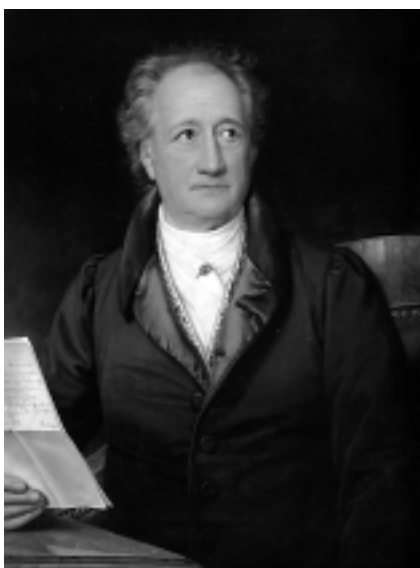
Johann Wolfgang von Goethe (1749-1832), escritor e pensador alemão

Antes de ser imortalizado por Goethe, o mito de Fausto teve um sem número de versões e um antecedente histórico. A lenda do homem que assina um contrato com o Diabo em troca de sucesso é bem mais realista, se considerarmos o período da história em que a prática de feitiçaria e a magia eram comuns entre os conhecimentos clássicos.