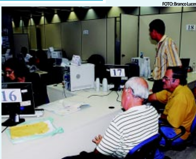
A entrega da declaração de IR será encerrada no dia 29 de abril