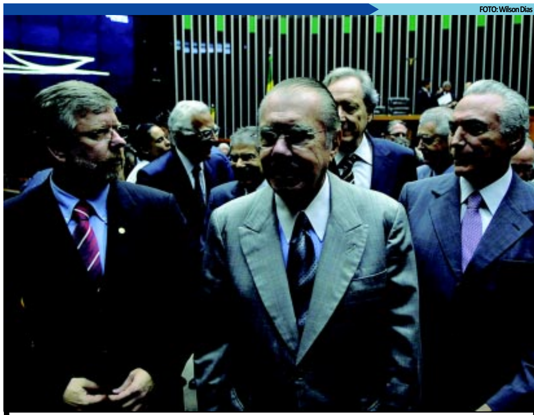
Marco Maia, José Sarney e o vice-presidente da República Michel Temer na instalação da Reforma na Câmara

O relator da comissão, ex-líder do governo na Câmara, Henrique Fontana (PT-RS), elegeu o financiamento público de campanha como o pilar da reforma. "O financiamento público traz igualdade para as eleições. Esse instrumento é a maior economia que o povo brasileiro fará e vai gerar governos com maior legitimidade e com menor vulnerabilidade a pressões de financiadores de campanha", afirmou Fontana.